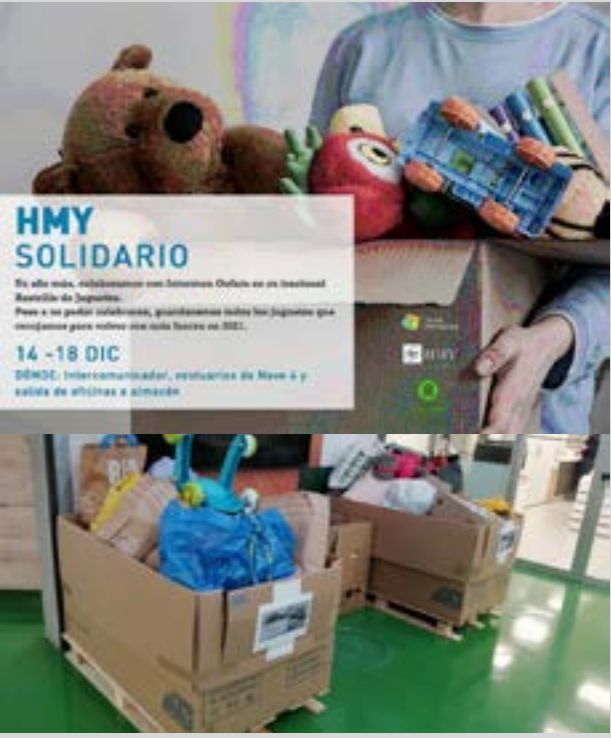
HMY Solidario, collecte de jouets. HMY Espagne