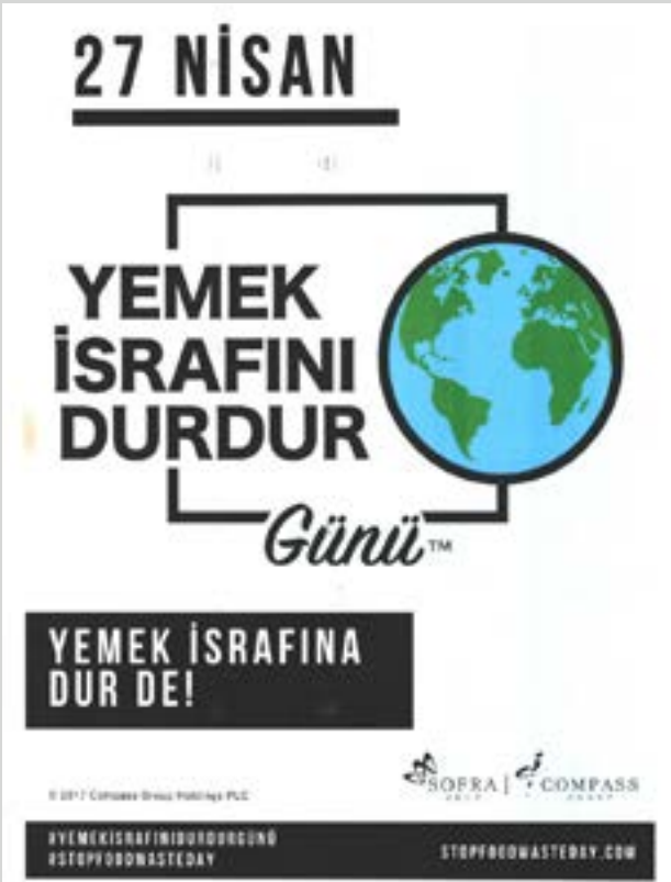
Campagne contre le gaspillage. HMY Turquie