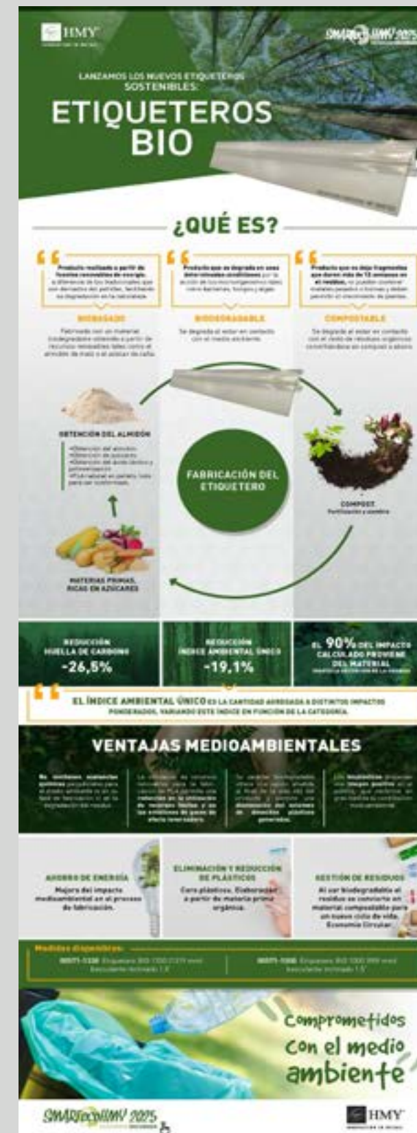
Lancement du Porte-étiquette biodégradable