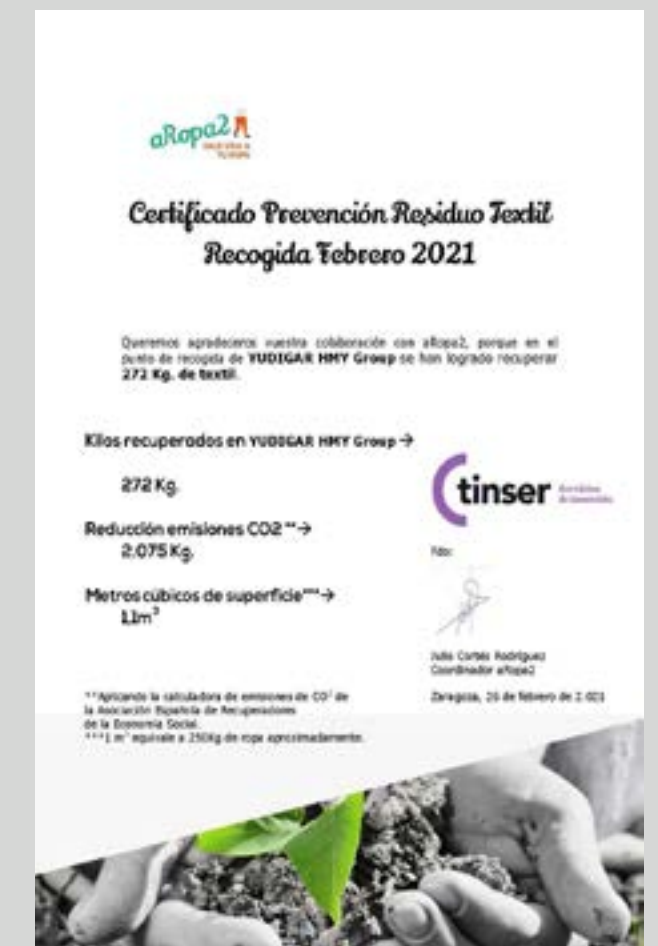
Certificat de prévention certifié des déchets textiles de nos clients