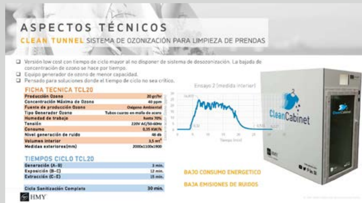
Fiche technique de lancement de la cabine de nettoyage «Covid-19». Armoire propre

Nous travaillons sur la base des préceptes de l'éco-conception dans tous nos processus : conception, ingénierie et fabrication. Nous entendons ainsi parvenir à un commerce de détail durable, bénéfique pour la planète, engagé pour la société et rentable pour les entreprises.