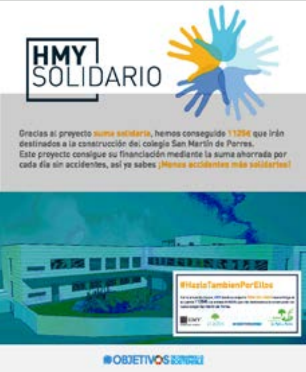
Projet de solidarité. HMY Espagne