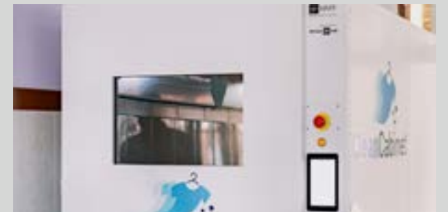
Tunnels O3 pour la désinfection COVID.

L'objectif pour 2021 est d'atteindre 35% des ventes avec l'intégration de l'un des produits phares de HMY, la famille P25.