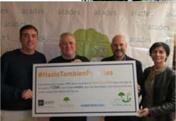
Sponsoring de la campagne ATADES. HMY Espagne