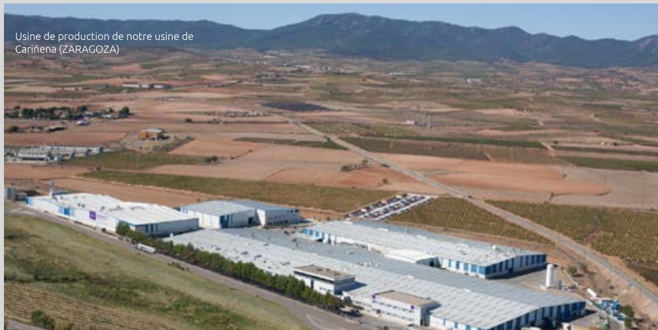
Usine de production de notre usine de Cariñena (ZARAGOZA)

Parmi les actions que nous avons menées en 2020, on compte :