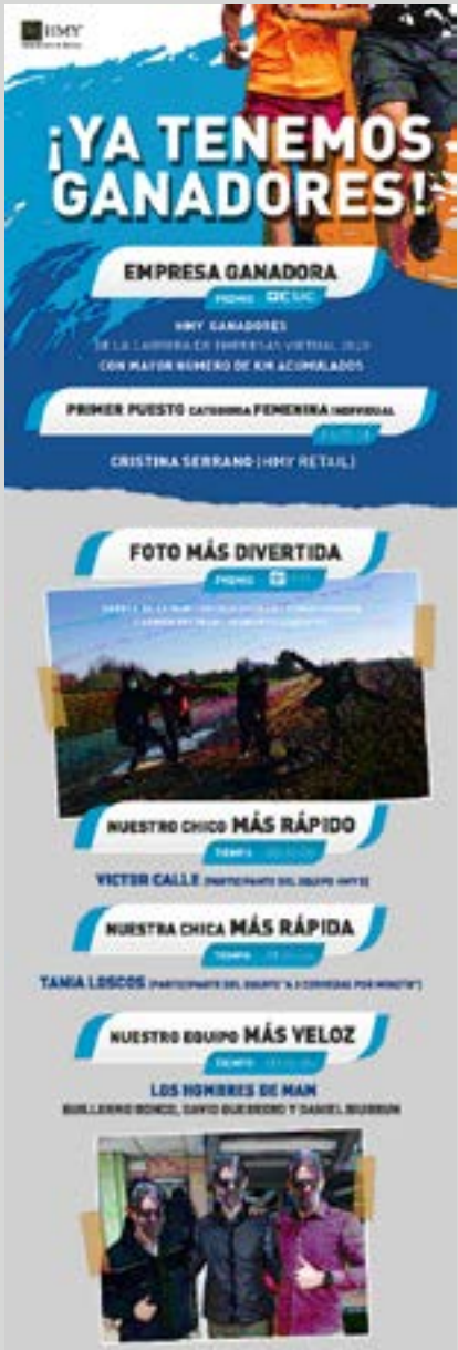
Carrière ESIC Business. HMY Espagne