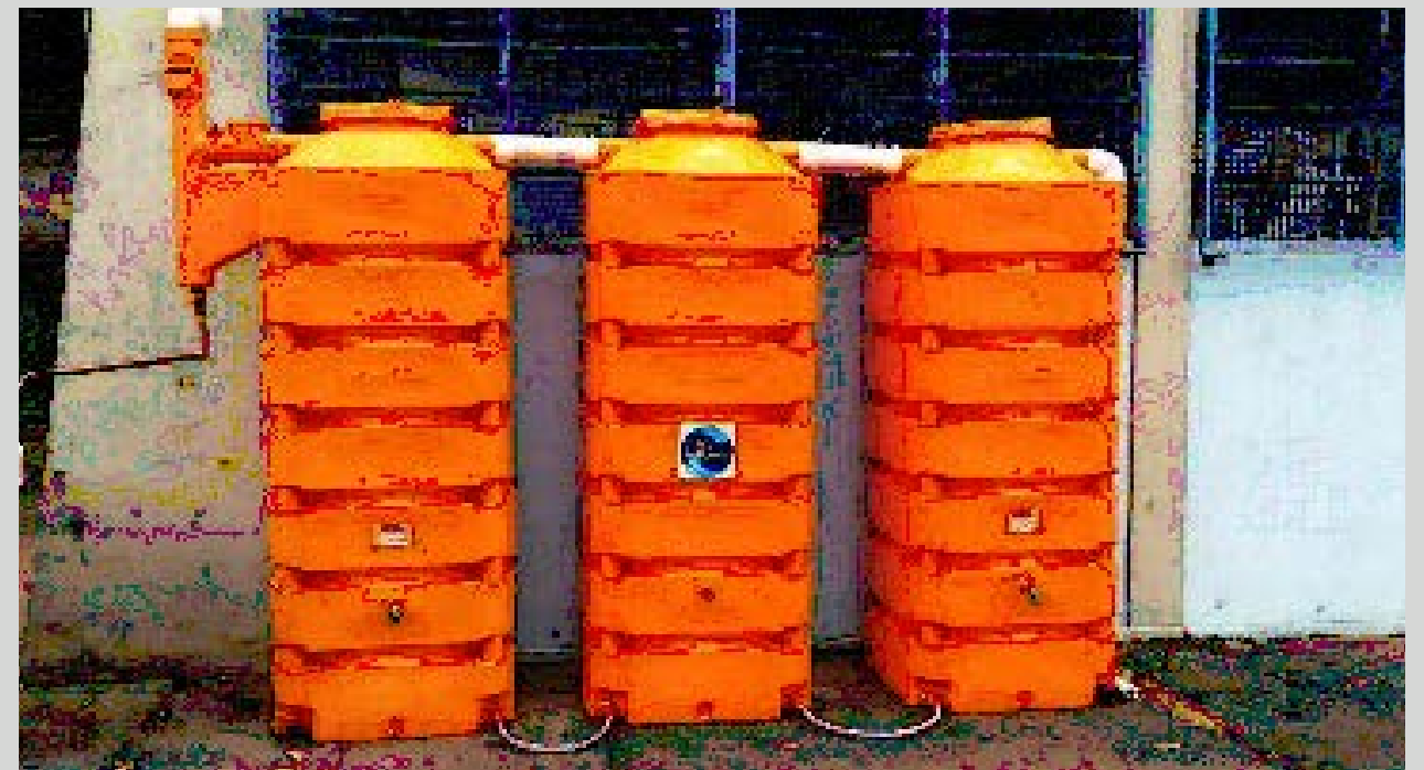
Systèmes de collecte des eaux pluviales